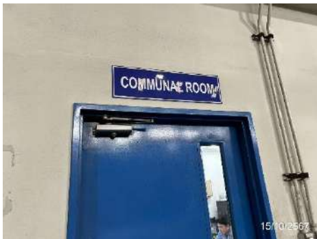
ภาพที่ 2-25 ห้องพักสำหรับพนักงาน