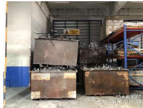
ถังเหล็กเก็บเศษเหล็กติดอะลูมิเนียม