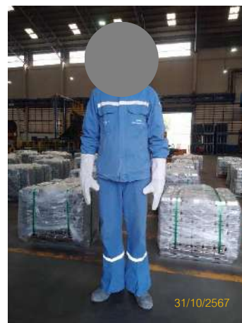
ภาพที่ 2-7 พนักงานสวมใส่อุปกรณ์ป้องกันอันตรายส่วนบุคคล