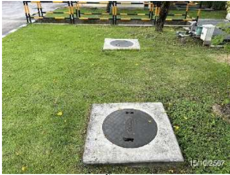
ภาพที่ 2-10 ระบบบำบัดน้ำเสียสำเร็จรูป (Septic Tank)