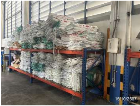
ภาพที่ 2-21 ถุงกระสอบ Big Bag สำหรับใส่ของเสียปนเปื้อน