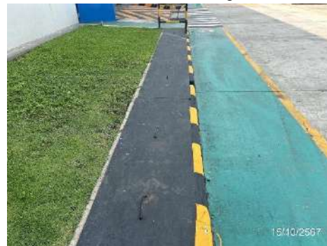
ภาพที่ 2-13 รางระบายน้ำฝน