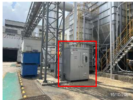
ระบบดักกลืน