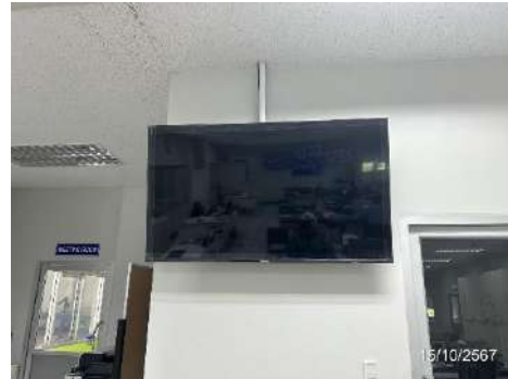
ภาพที่ 2-29 ระบบเก็บข้อมูลแสดงผลผ่านหน้าจอคอมพิวเตอร์จากแผงเซลล์แสงอาทิตย์