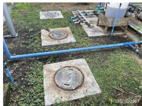
ภาพที่ 2-9 ถังดักไขมันบริเวณโรงอาหาร