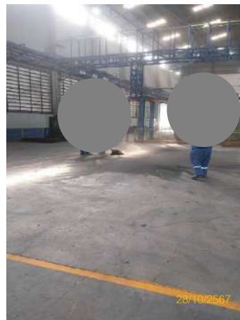
ภาพที่ 2-30 พนักงานทำความสะอาดบริเวณภายในพื้นที่โครงการ