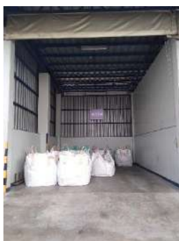
ถุง Big Bag เก็บฝุ่นจากระบบบำบัด