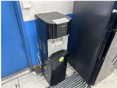
ภาพที่ 2-23 ถังน้ำดื่ม