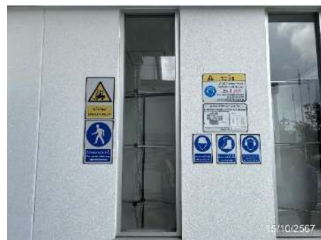
ภาพที่ 2-8 ป้ายเตือนให้สวมใส่อุปกรณ์ป้องกันอันตรายส่วนบุคคล และป้ายเตือนอันตรายในพื้นที่โครงการ (ต่อ)