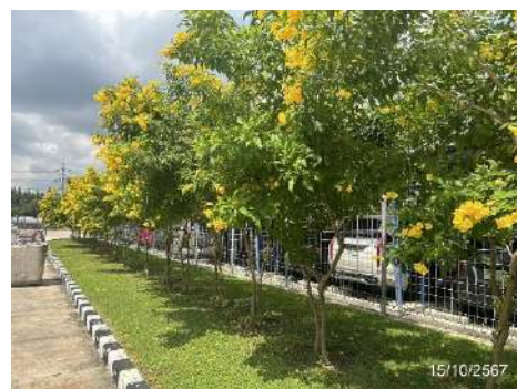
ภาพที่ 2-6 ไม้ยืนต้นบริเวณของเขตพื้นที่โครงการ