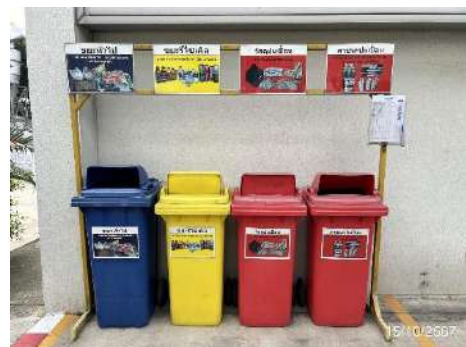
ภาพที่ 2-17 จุดวางถังขยะแยกตามประเภท