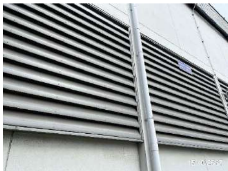
ภาพที่ 2-3 ระบบระบายอากาศในอาคาร บริเวณที่มีความร้อนสูง