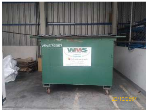
ภาพที่ 2-18 พื้นที่รวบรวมขยะมูลฝอย