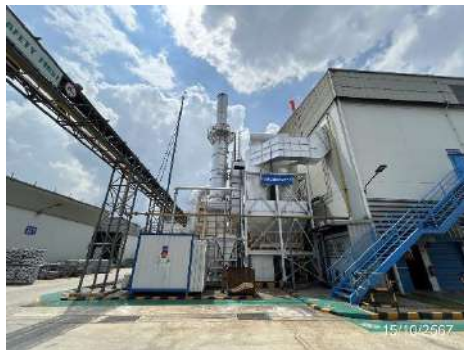
DC No.1 : Furnace