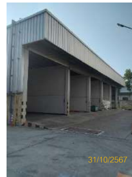
ภาพที่ 2-19 พื้นที่จัดเก็บของเสียจากกระบวนการผลิต