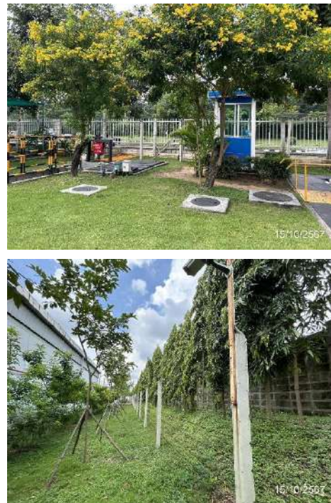
ภาพที่ 2-6 ไม่ยืนยันบริเวณของเขตพื้นที่โครงการ (ต่อ)