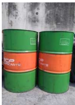
ถังเหล็ก 200 ลิตร จัดเก็บน้ำมันเครื่องใช้แล้ว