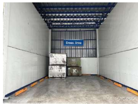
ถังเหล็กสำหรับใส่ตะกรันอะลูมิเนียม