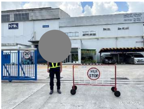
ภาพที่ 2-14 เจ้าหน้าที่อำนวยความสะดวก บริเวณเข้า-ออก โครงการ