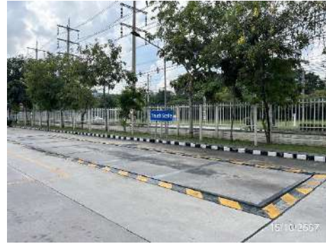
ภาพที่ 2-15 เครื่องซังน้ำหนักรถบรรทุก