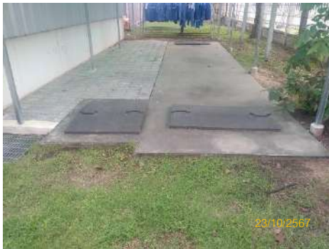
ภาพที่ 2-12 บ่อพักน้ำฉุกเฉิน (Emergency Pond)