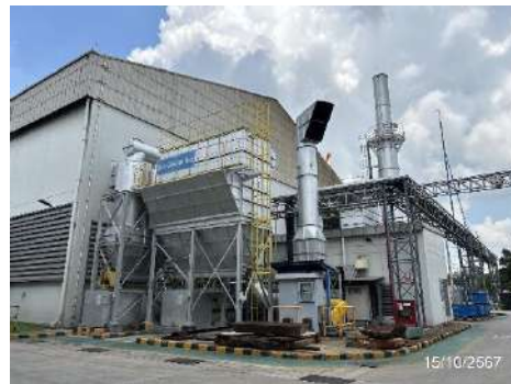
DC No.2 : MRM