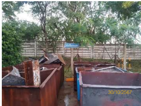
ถังเหล็กเก็บเศษเหล็ก