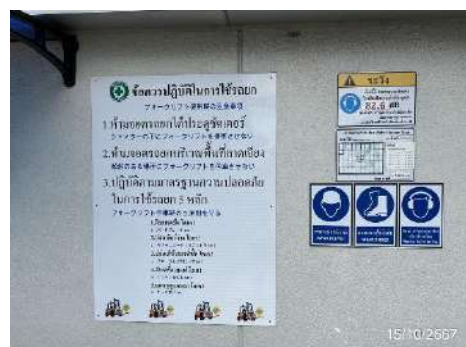
ภาพที่ 2-8 ป้ายเตือนให้สวมใส่อุปกรณ์ป้องกันอันตรายส่วนบุคคล และป้ายเตือนอันตรายในพื้นที่โครงการ