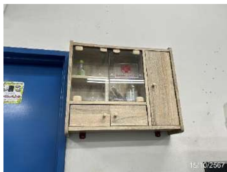
ภาพที่ 2-26 เวชภัณฑ์ยา