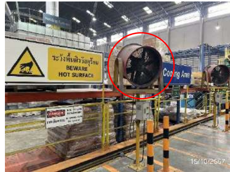
ภาพที่ 2-24 พัฒนาระบายอากาศ บริเวณเสี่ยง ต่อการสะสมความร้อน