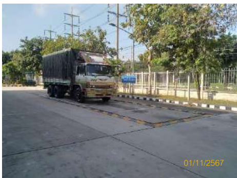
ภาพที่ 2-16 ผ้าใบปิดคลุมรถบรรทุกที่มีดขีด