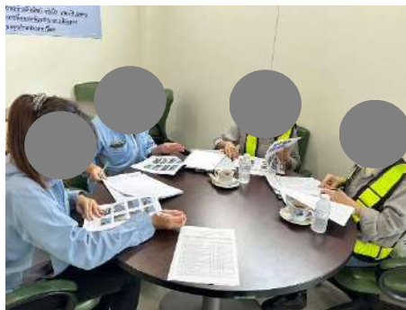
ภาพที่ 2-1 การติดตามตรวจสอบการปฏิบัติตามมาตรการฯ

จากการตรวจสอบการปฏิบัติตามมาตรการป้องกันและแก้ไขผลกระทบสิ่งแวดล้อม โครงการโรงงานหลอมและหล่ออะลูมิเนียมแห่ง (ครั้งที่ 1) บริษัท นิคเคอิ เอ็มซี อลูมิเนียม (ประเทศไทย) จำกัด (ระยะดำเนินการ) เมื่อวันที่ 15 ตุลาคม 2567 สามารถสรุปผลการปฏิบัติตามมาตรการป้องกันและแก้ไขผลกระทบสิ่งแวดล้อม ดังรายละเอียดในตารางที่ 2.2-1 และเอกสารอ้างอิงประกอบการปฏิบัติตามมาตรการฯ ในภาคผนวกที่ 1