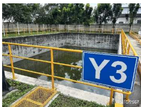
ภาพที่ 2-28 บ่อท่อน้ำฝนของโครงการ