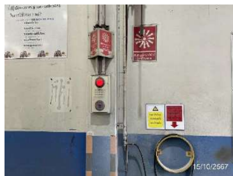
ภาพที่ 2-27 ระบบป้องกันและระงับอัคคีภัยในพื้นที่โครงการ