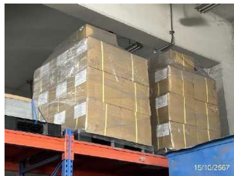
ภาพที่ 2-4 อะไหล่สำรองและอุปกรณ์