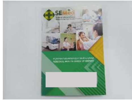
ภาพที่ 2-22 ตัวอย่างสมุดสุขภาพพนักงาน