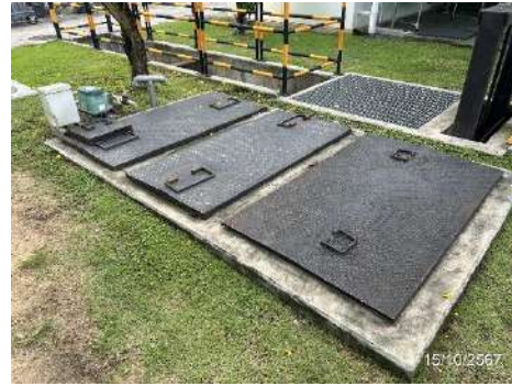
ภาพที่ 2-11 บ่อตรวจสอบ (Inspection Pit) และบ่อพักน้ำทิ้ง (Holding Pond)